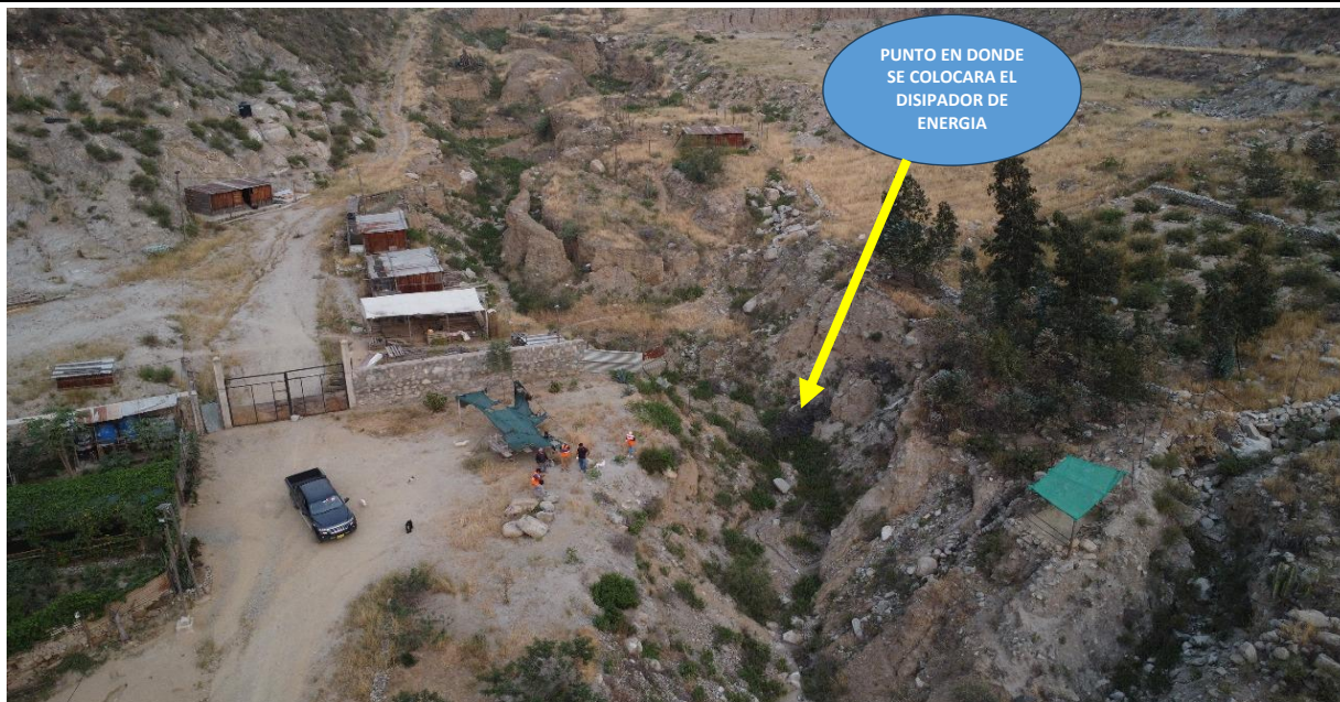
SECTOR QUEDBRADA CUPICHE I