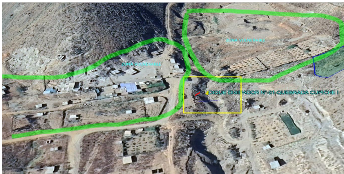
5.- IMAGEN SATELITAL DE ZONA VULNERABLE